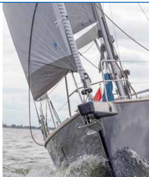
Subtiel boegspriet, reeds in de mal aangebracht.

De 55CS waarmee we varen, is daarop geen uitzondering: “De eigenaar heeft gekozen voor hydraulische rolzeilen, elektrische lieren en een kotterslag.” Vanaf de stuurconsole kunnen we met een druk op de knop het grootzeil uit de mast laten rollen. De code 0 is reeds aangeslagen op de vaste boegspriet. Alleen de roller van de code 0 vraagt nog om bediening met de hand,