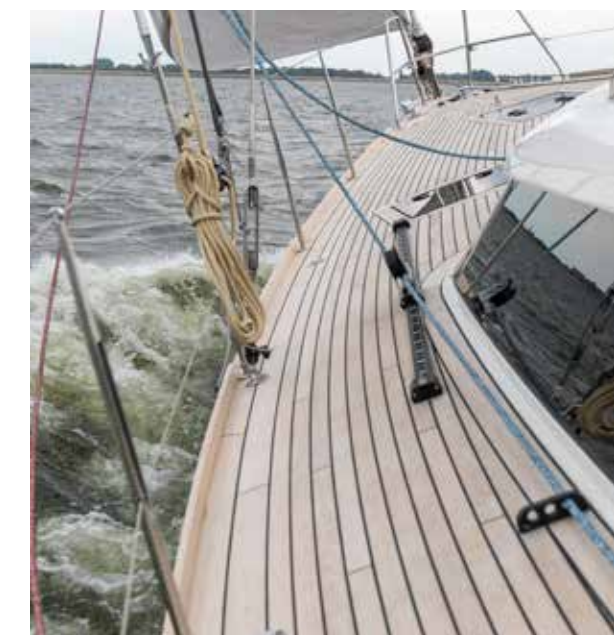
De genuarails staan relatief ver naar buiten; de doorloop naar voren is uitstekend.